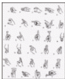
Lenguaje de signos