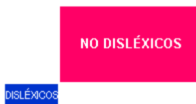
Fig. 1. Modelo discreto

El modelo continuo (figura 2) admite una transición gradual entre la normalidad y la dislexia.