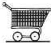
Coger el carrito

Horario Comprobarás que una agenda visual con los diferentes pasos de la salida de compras incrementará la comprensión de tu hijo sobre lo que está pasando. A algunos niños les irá mejor con una enumeración de todos los pasos detallados, en cambio otros necesitarán sólo uno o dos pasos en la secuencia.