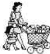
Hacer la compra