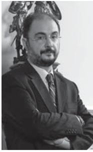
Javier Lambán Montañés Presidente de la Diputación Provincial de Zaragoza

La Federación Española de Sordoceguera (FESOCE) está formada por un colectivo de personas que, por encima de todo, tienen la virtud de mostrarnos su espíritu de superación y que luchan y defienden sus legítimos derechos para mejorar la calidad de vida de la población sordociega y de sus familias, como lo hace el resto de la sociedad.