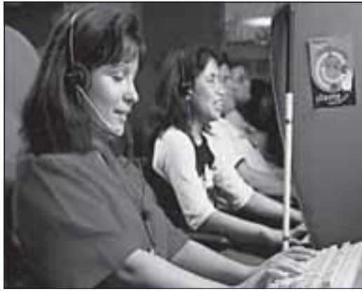
Trabajo en un Call Center

Termino mi carta no sin antes confirmar a los lectores que los nuevos responsables de FOAL, incluido el equipo