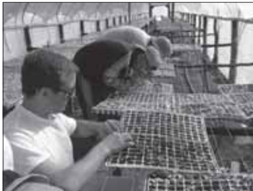
Trabajo en un vivero

técnico, harán buena la regla de oro de la gestión empresarial: “los nuevos que vienen siempre mejoran la gestión de los que se van”. Sé de muy buena tinta que no descansarán hasta que América, toda entera, la hispana y la lusa, forme parte de un gran programa que sea capaz de terminar con casi todos los gritos de: ¡quiero un trabajo!