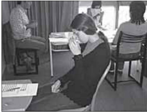
Cata de aceite de oliva