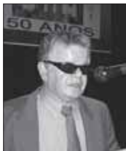
José Monteagudo Presidente de ULAC

En la página editorial de «América Latina» hemos abordado muchos temas que tienen interés e importancia como ideas de orientación y puntos de partida útiles en nuestra lucha común por encontrar mejores oportunidades para las personas con discapacidad visual. Así se ha escrito acerca de la necesaria unidad de nuestro movimiento, de la justeza y necesidad de la participación plena de la mujer ciega en la actividad social dentro de nuestro sector y en su dirección; de la imprescindible atención a los jóvenes, nuestro natural relevo y de muchos otros.