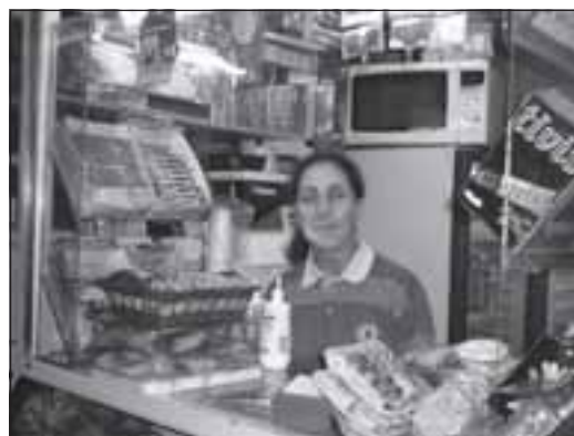
Kiosco Cadena Q